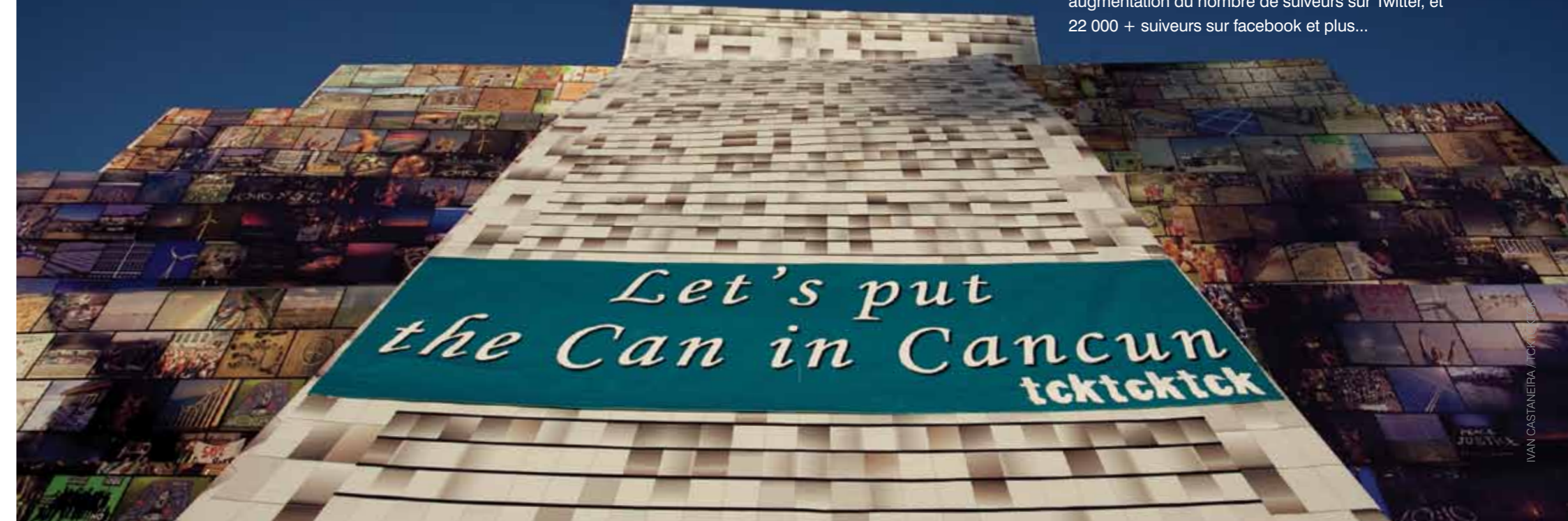
IVAN CASTANEIRA / TCKTCKTCK