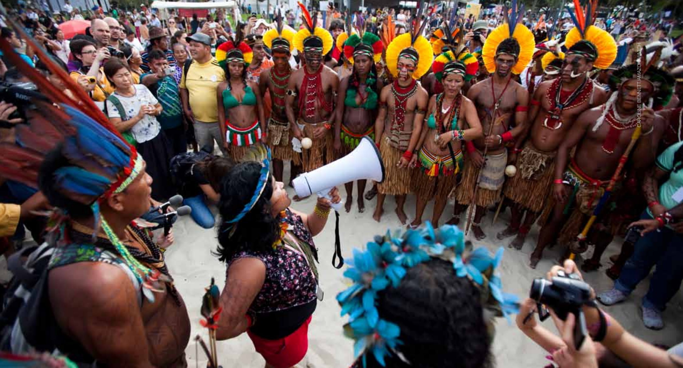
CAROLINE BENNETT/AMAZON WATCH