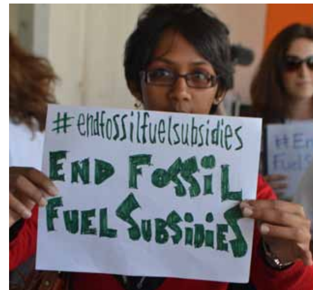
ADOPTÉZ UN NÉGOCIATEUR

À peine quelques semaines après cette avancée majeure, il était difficile d'assister à la clôture décevante de la COP 18 de Doha. Au lieu de s'engager résolument pour élever l'ambition des mesures de réduction des émissions et pour accélérer le financement climatique des actions nationales, bien trop de pays présents à Doha ont tergiversé et repoussé ces mesures. Les États-Unis et de nombreux autres pays développés ont consacré l'essentiel de leur temps et de leur énergie à exposer ce qu'ils ne pouvaient faire, plutôt qu'à offrir des solutions constructives. Les ministres n'ont finalement pas eu d'autre choix, désagréable, que d'accepter un accord extrêmement faible, sous peine de voir les débats échouer dans l'amertume et le désespoir – sans aucune orientation claire pour aller de l'avant. À la fin, ils ont accepté de poursuivre les discussions, mais il est clair que, sans une grande dose de volonté politique et de leadership, il ne sera pas question de trouver un accord d'ici 2015 sur un nouveau traité climatique ambitieux et équitable, contraignant l'ensemble des pays à agir.