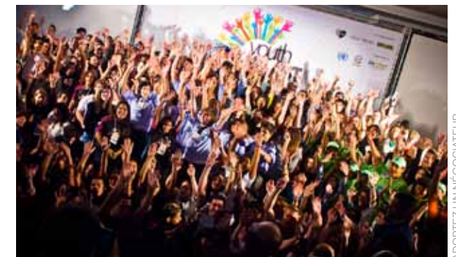
ADOPTÉZ UN NEGOCIATEUR

Commandée par les pays les plus vulnérables au changement climatique et coordonnée par DARA, partenaire de la CIAC, la seconde édition du Climate Vulnerability Monitor est l'évaluation la plus complète jamais réalisée des conséquences actuelles du changement climatique, et elle donne matière à réfléchir. Les conclusions mettent en évidence des préjudices sans précédent causés