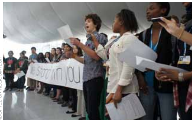
ADOPTÉZ UN NÉGOCIATEUR

Je veux remercier tous les partenaires et les alliés de la CIAC de vos efforts au cours de l'année passée, que ce soit au niveau local, national ou international. Permettez-moi aussi de remercier le secrétariat de la CIAC pour son travail considérable et son leadership. Alors que nous avons accompli une grande partie de notre travail ensemble, il est vrai aujourd'hui, comme ce l'était déjà dans les neiges de Copenhague il y a trois ans, que « ce n'est pas encore ça ». ●●●●●