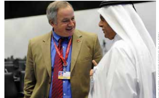
ISD/EARTH NEGOTIATIONS BULLETIN

Nous avons tiré une leçon importante de ces dernières années : quand bien même ils peuvent être source de frustration, les conférences et sommets internationaux sur le climat donnent aussi l'occasion d'éveiller l'intérêt dans