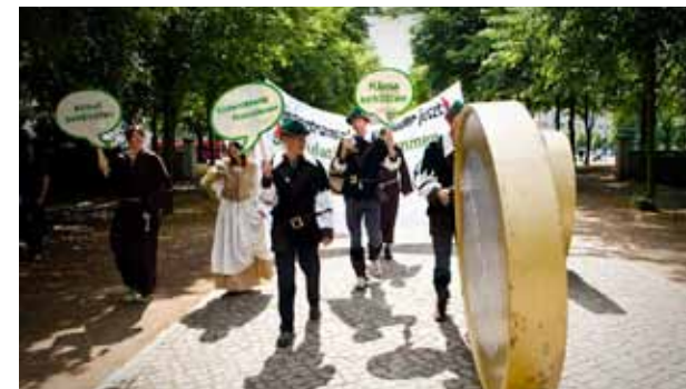
OXFAM INTERNATIONAL, 2011

Les partenaires de la CIAC de plus de 35 pays demandent aux dirigeants européens de soutenir une taxe sur les transactions financières à 0,05 % (TTF ou taxe Robin des Bois), qui générerait des centaines de milliards de dollars afin de lutter