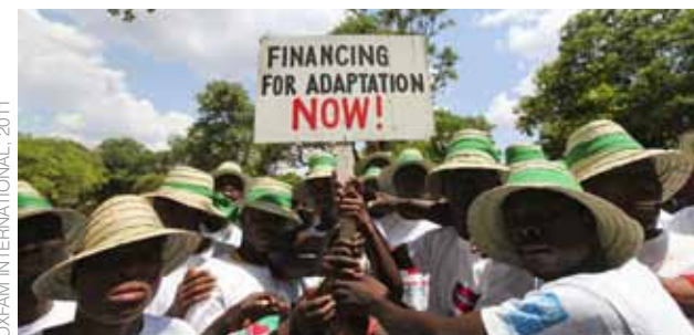
OXFAM INTERNATIONAL, 2011

L'année 2011 a, de bien des manières, constitué une année de transition pour la CIAC. Cela se reflète pour le financement avec une baisse des revenus anticipée, puisque les subsides gouvernementaux initiaux, prévus sur deux ans, arrivent bientôt à terme. Le changement le plus notable se trouve dans la réduction des fonds alloués au soutien de campagnes nationales isolées, qui fait suite à la décision stratégique de se concentrer davantage sur des campagnes mondiales et des interventions conjointes susceptibles d'avoir un fort impact dans des régions importantes.